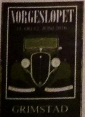
PLAKAT. Det er mye Grimstad-tekst i brosjyren for biløpet.

Tema for løpet er jernverk og sjøfart. Deltakerne kjører til Froland