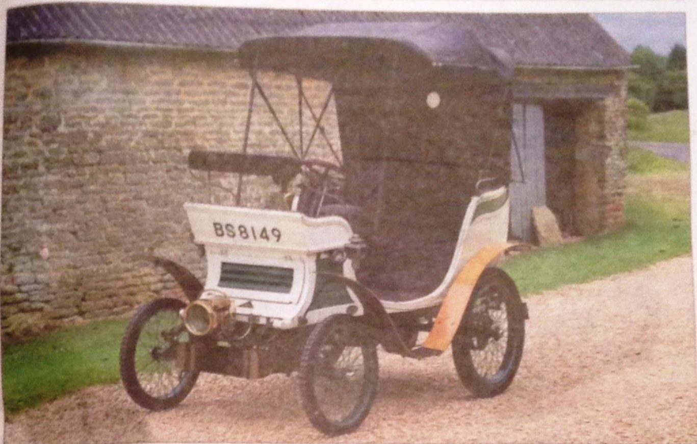
SUPERVETERAN. Eldste kjøretøy så langt er en 1901 modell Linon fra Kongsberg. Eieren heter Torgeir Krøgen. Det er to slike biler i verden.